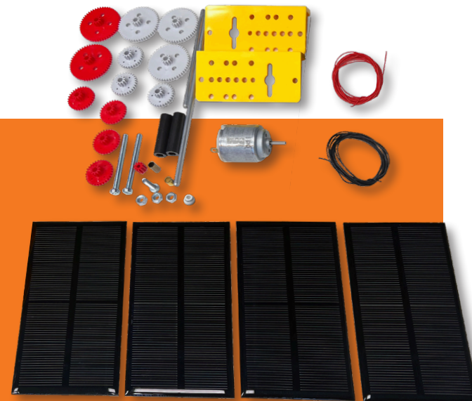
Der Bausatz: vier Solarzellen, ein Getriebemotor, Montagewinkel, Zahnräder, Kabel und Schrauben

Tipp: Die Solarteststation hat einen Radius von 90 cm, ist also 1,80 m breit. Die Lampe, die die Sonne darstellt, ist auf einer Höhe von 90 cm angebracht.